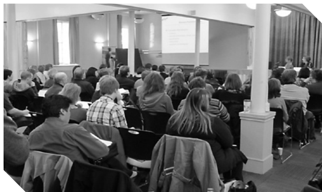
Quelque 130 personnes ont participé au Forum Transfert et partage des savoirs – Avril 2012

Soutenue financièrement par le Secrétariat à l'action communautaire autonome et aux initiatives sociales (SACAIS), une recherche exploratoire a pu être réalisée cette année par le Centre St-Pierre.