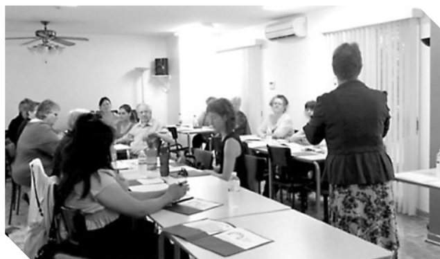
Atelier de formation sur mesure Mieux coopérer et prévenir les conflits demandé par l'Office municipal d'habitation de Montréal (OMHM) avec les locataires des HLM du secteur est.

Il n'est pas rare que ces accompagnements s'échelonnent sur quelques années. De plus, les accompagnateurs n'hésitent pas à utiliser une approche intégrée en sollicitant l'expertise d'autres formateurs du Centre St-Pierre sur certains thèmes spécialisés.