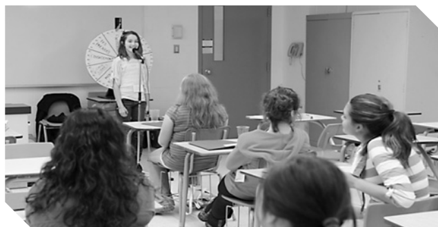
Prendre la parole en public : ça s'apprend! avec les jeunes du Forum Jeunesse Longueuil – Mars 2011

Les thématiques que les organisations souhaitent dorénavant aborder sont liées à la gestion des ressources humaines, au développement organisationnel et aux questions de planification. D'autres thèmes demeurent toujours populaires. C'est le cas de l'animation d'équipes et d'assemblées, les rôles et responsabilités d'un conseil d'administration et de l'apprentissage de la parole publique.