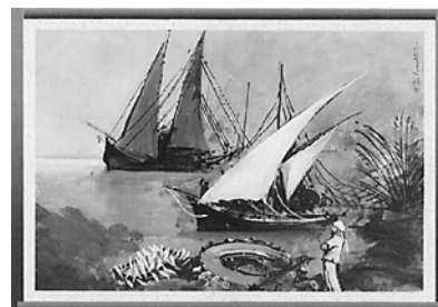
Œuvre de Nicolas Zeitouni

Place à l'exposition de peintures de l'Association multiethnique pour l'intégration des personnes handicapées. La vente des œuvres a permis à l'Association de s'auto-financer. Coup de cœur de l'année! Un succès de vente!